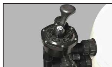
Equipado con una válvula selectora de 6 vías.