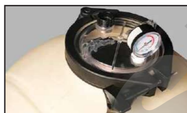
Manómetro de fácil lectura por un control sencillo.